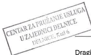
Dragica Glad Dožaić, ravnateljica